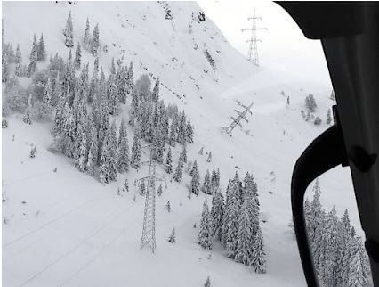
Ausfall in Salzburg